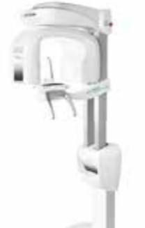
Acteon X-Mind Prime 3D