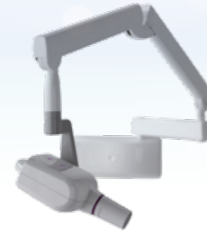
MyRay RXDC eXTend