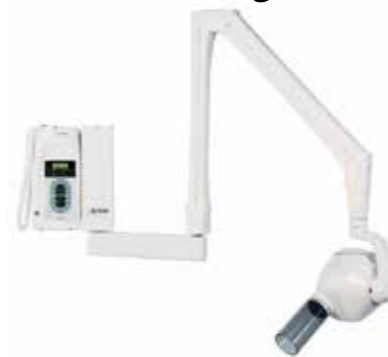
Acteon X-Mind DC intraoraal röntgen

Utrecht Dental beschikt over een stralingsbeschermingsdeskundige niveau 3. Zo nemen wij u alle zorg uit handen.