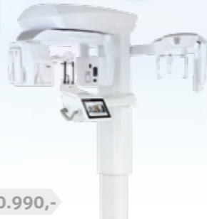
MyRay X9 Pro