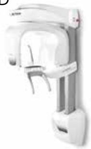
Acteon X-Mind Prime 2D