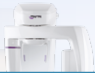
MyRay X5 Air 2D systeem