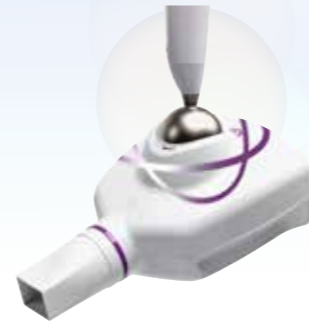
MyRay RXDC HyperShere