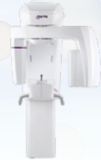
MyRay X5 3D Conebeam systeem