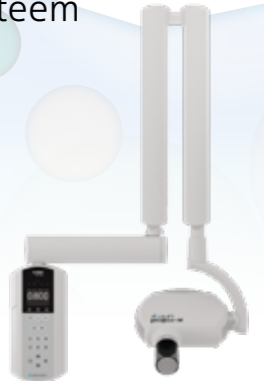
Acteon X-Mind Unity DC röntgensysteem